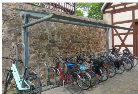
Muster einer geeigneten Abstellanlage (Beispiel aus Kirchheim/Teck)